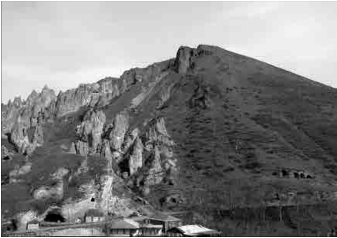
Լաստի կալից, ասե թե, մայր Աստվածն է շունչ փախս...