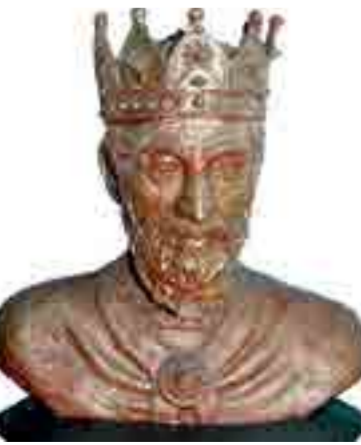
Սյունիքի Գրիգոր Ա թագավոր (դեմքի վերականգնումը՝ պրոֆեսոր Ճաղարյանի): Կիսանդրին պահպանում է Կապանի երկրագիրական թանգարանում: