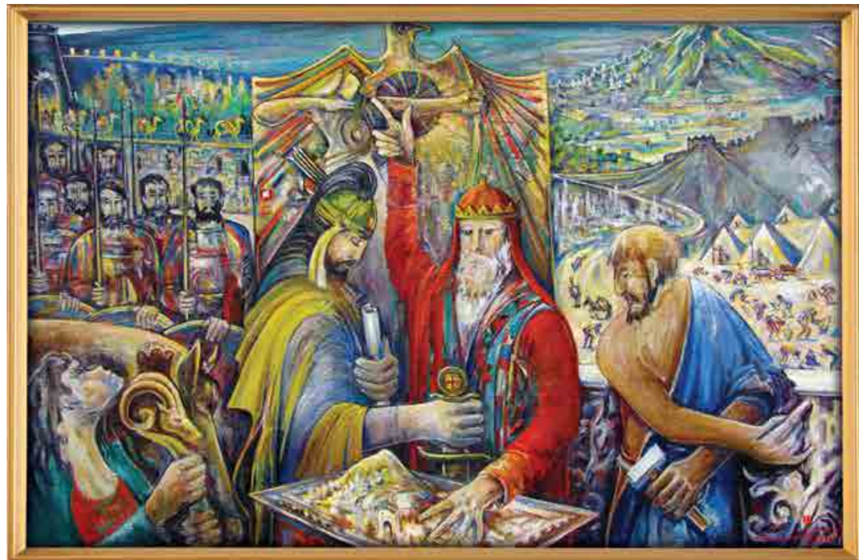
Զագ Նահապետը հիմնադրում է Զագեճորի բերդը (Ռոբերտ Կամոյան, 2010թ.: Պատվերը՝ «Այոցյաց երկիր» թերթի):