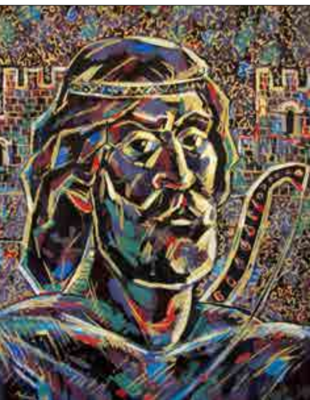
4108 փարի հեփո՝ 2008թ., Սիսակ Նահապետի Նկարը սպեղծագործել է կապանցի գեղանկարիչ Ռուբեն (Ուբակ) Կոստանյանը «Այոցյաց երկիր» պարվերով (թուղթ, ակրիլ, փեմպերա, պաստել, բրոնզ, 45x57, գրաֆիկական աշխատանք):