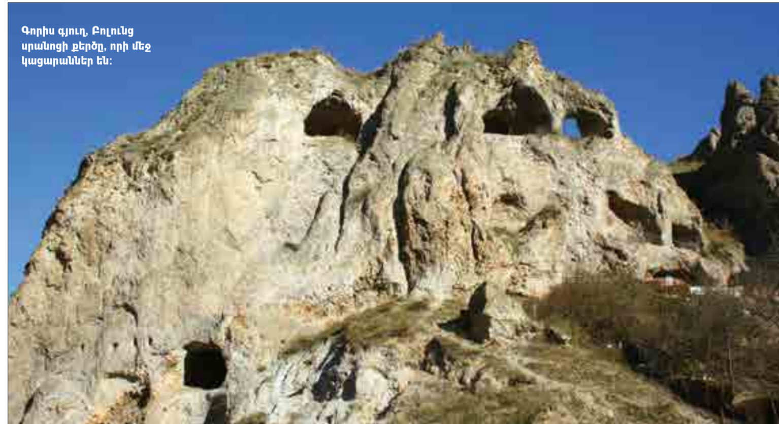
Գորիս գյուղ, Բոլունց սրանոցի քերձը, որի մեջ կացարաններ են: