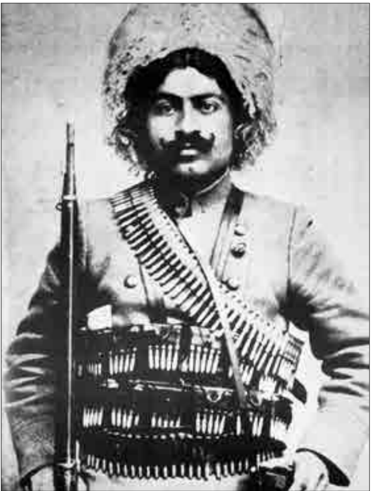
Սպարապետ Գարեգին Նժդեհ