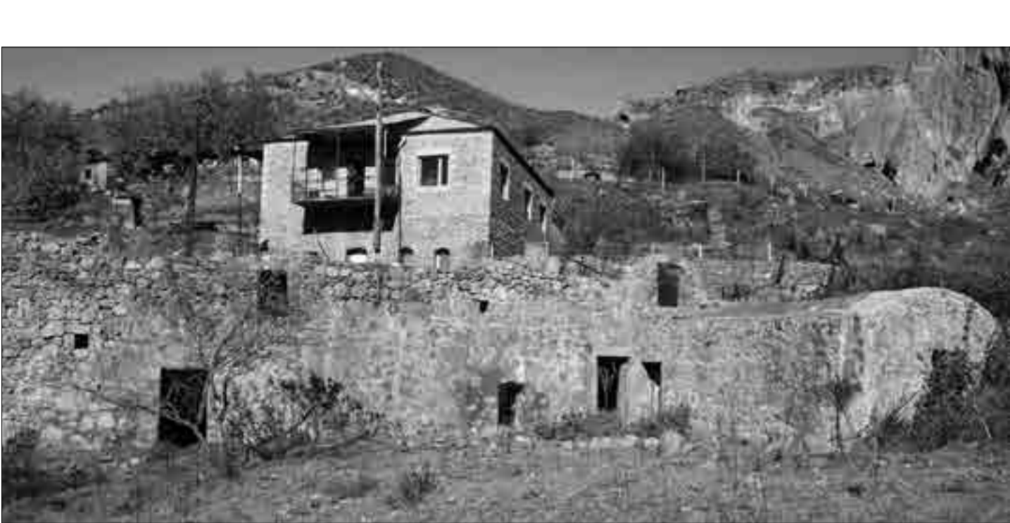
Քղափն (Միրումյանների) ձիթհանը (սրանոցը) Գորիս գյուղում