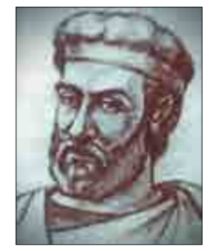
Անդրով/Անդով/Սյունի, Սյունյաց Նախարարության մեծ Նահապետ