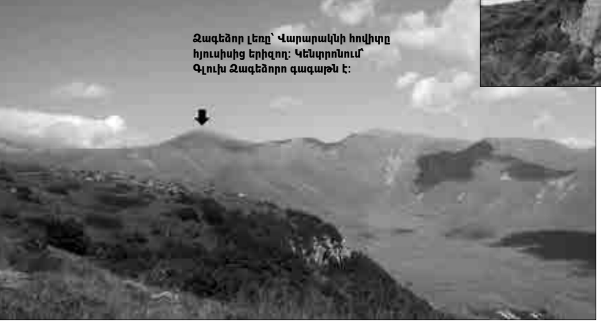
Ջագենոր լեռը՝ Վարարակնի հովիտը հյուսիսից երիզող: Կենտրոնում՝ Գլուխ Ջագենոր գագաթն է: