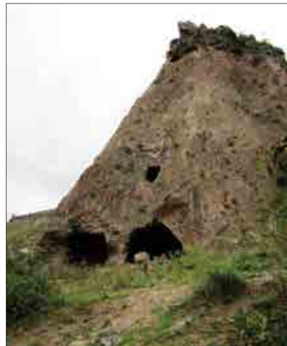
Հին կացարան Գորիս գյուղում

Գորիսի քարանձավները (քարայրերը, քարատակները, քրդտակները) հնագույն ժամանակներում (նաև հետո՝ դարեր շարունակ) մարդկանց համար կացարանի դեր են կատարել, ինչպես եւ օգտագործվել պաշտպանական նպատակներով: Իսկ Շենը՝ Կյորեսի միջնաբերդը, բաղկացած էր ժայռափոր կառույցներից: