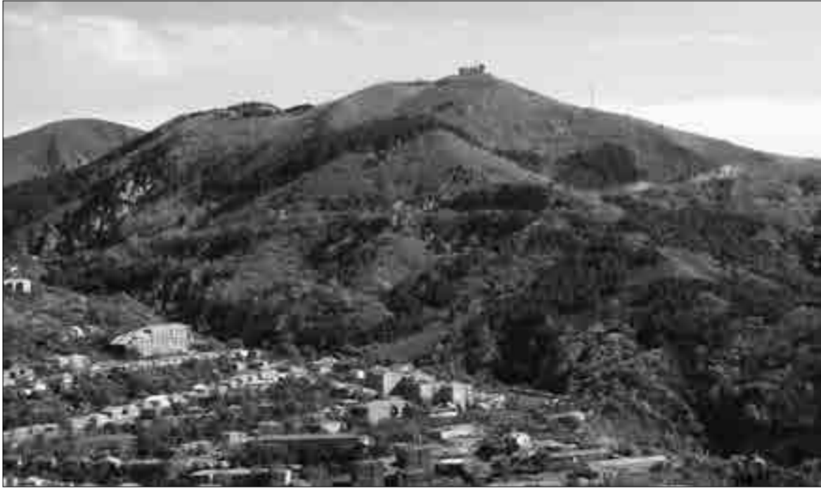
Պորդափուր գագաթը՝ Գորիս արևելքից երիզող Չարքալի սարի վրա: